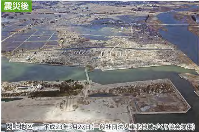
関上地区 平成23年3月27日