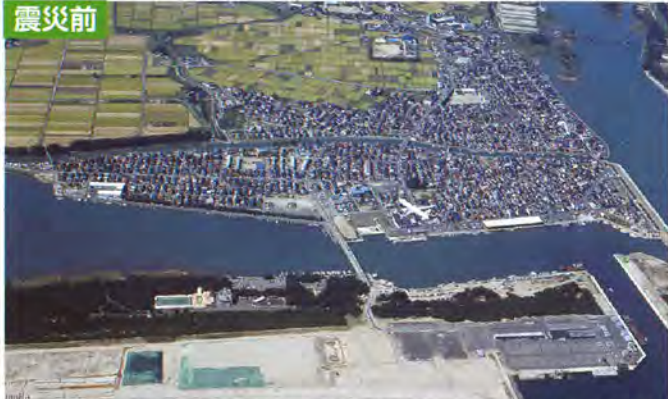
関上地区 平成13年9月24日